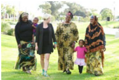
После 19 лет разлуки мать и дочь воссоединились благодаря службе розыска Красного Креста.