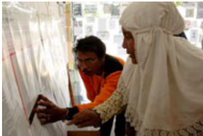
Женщина ищет имена своих внуков в списке, опубликованном Центром по розыску Красного Креста в Индонезии.